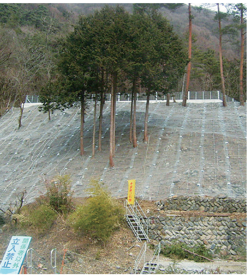
Segera setelah selesai

Kementerian Pertanian, Infrastruktur, Transportasi dan Pariwisata: Nomor Registrasi Sebelumnya Sistem Penyediaan Informasi Teknologi Baru (NETIS):HR-060003-A