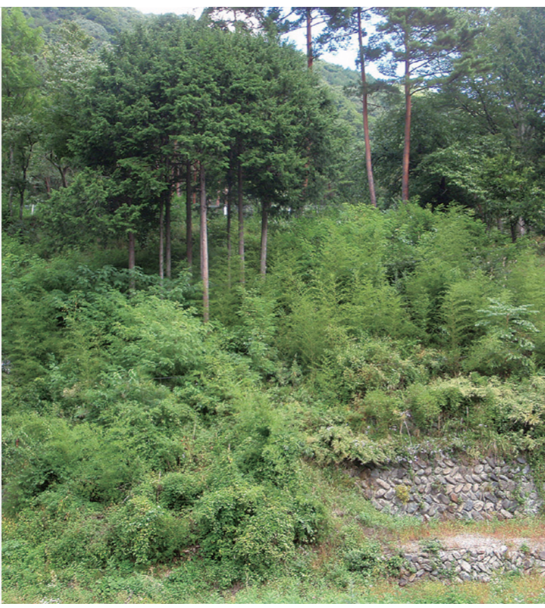
Telah lewat 20 bulan