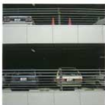
■多摩ニュータウン立体駐車場